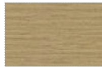
дуб флоре, шпон