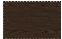
орех мароне, шпон